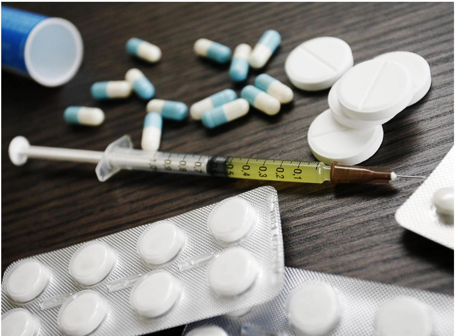
BIG BUSINESS: I fjor kjøpte nordmenn medisin for 17,4 milliarder kroner.